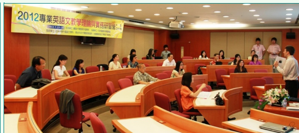
圖說：國外講者與參與教師於會場互動交流。