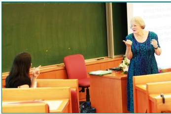
圖說：美國Margaret van Naerssen教授(右)於研習營中與教師們對話。

三校合辦的2012 ESP英語研習營為期4天，邀請專家學者講授英語文教學理論，並分享實務經驗。